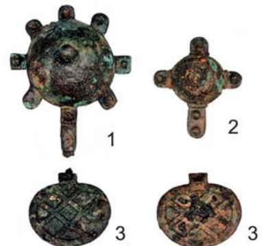
金銅装馬具（朝来市和田山町・春日古墳出土／朝来市埋蔵文化財センター蔵）