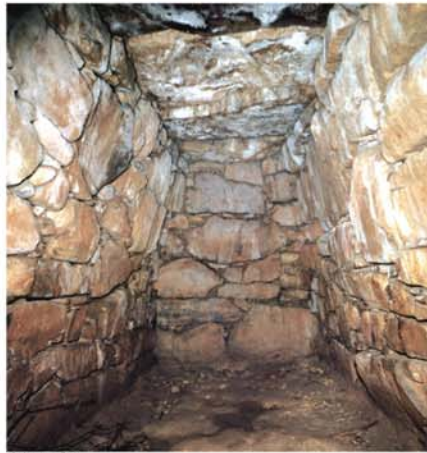
禁裡塚古墳の横穴式石室(長13.9m、高3.6m)

なぜ、古墳時代後期に、但馬の中心は朝来から養父へと移動したのでしょうか。まだ明確な答えはなく、一つの案に過ぎませんが、6世紀は、ヤマト政権が地方の支配体制を強化していく時代です。その中で、朝来よりも養父の豪族が積極的にヤマト政権に服属していったからだと考えています。