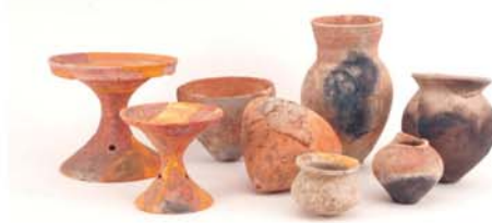
祢布ヶ森遺跡の弥生土器（弥生時代）