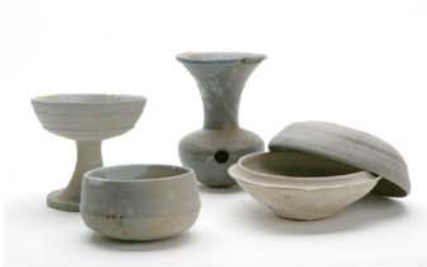
大藪古墳群出土の須恵器(養父市教育委員会蔵)