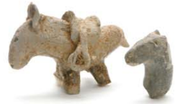
裝飾付須恵器部分 (禁裡塚古墳付近出土/養父市教育委員会蔵)