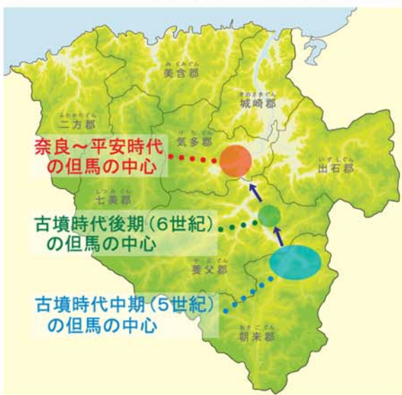
但馬の中心地の移り変わり（郡名は平安時代のもの）

7世紀に始まった天皇中心の新しい国家は、「全国の 掌握 しょうあく 」が大きな目標でした。そのため、国府の立地には 地理的・政治的に「国内行政がしやすい場所」が重視さ れていたのです。祢布ヶ森遺跡や但馬国分寺周辺は、東 西南北いずれにも通じる道があり、しかも朝来や養父に はない、安定した広い平野があります。安定した平野は、 今も昔も生活に適した土地であり、国府・国分寺の選地 にあたっては外すことのできない条件だったのです。