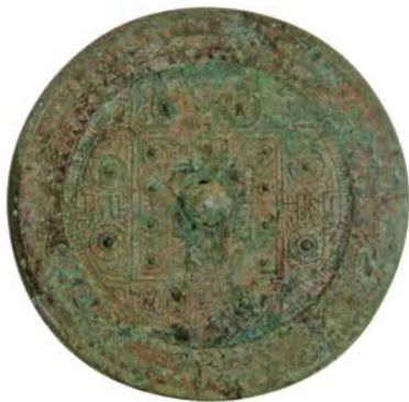
方格規矩八禽鏡（朝来市山東町・馬場19号墳出土／朝来市埋蔵文化財センター蔵）