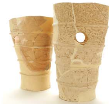
円筒埴輪（朝来市桑市・船宮古墳出土／朝来市埋蔵文化財センター蔵）