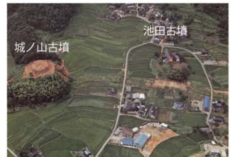
但馬の王墓、城ノ山古墳と池田古墳

この時代に朝来で栄えた但馬の王の姿は、王墓の副葬品から垣間見ることができます。それらはいずれも、ヤマト政権と強いつながりをもったものばかり。このことから、但馬の王は単に「地方の有力者」ではなく、中央に認められた人物であることを示しています。