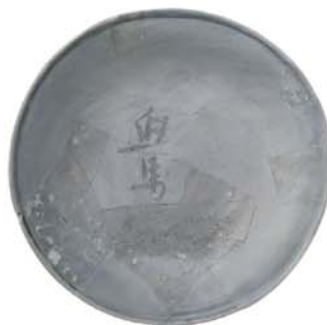
「但馬」と書かれた須恵器 (複製/平安時代/深田遺跡出土)

新しい国家は、新しい秩序のもとで地方を支配し、その支配の拠点が「国府」です。ただし、7世紀代の国府がどこにあったのかは、残念ながらわかっていません。