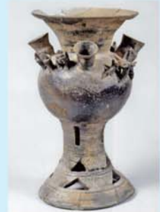
たつの市西宮山古墳出土の裝飾付須恵器

さまざまな飾りが付いた裝飾付須恵器は、葬送の際に祭器として使い、古墳に副葬したものです。