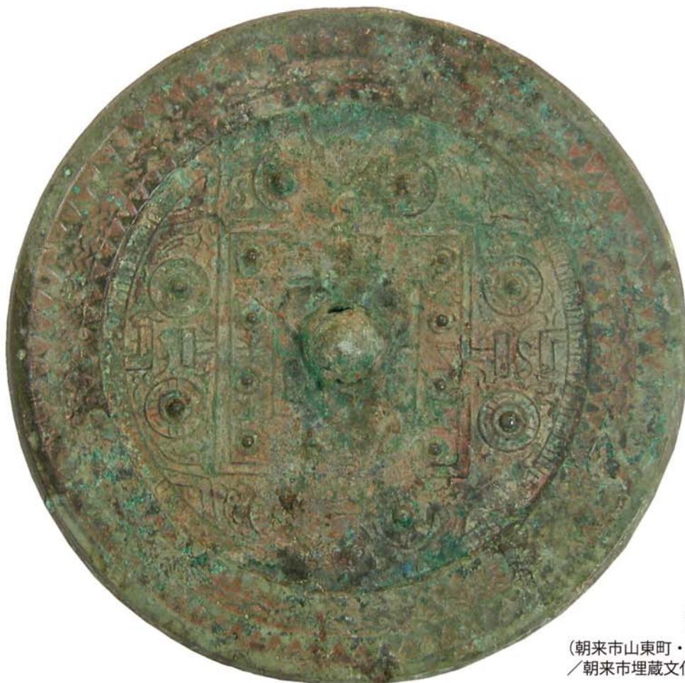
ほうかくきくはちきんきょう 方格規矩八禽鏡