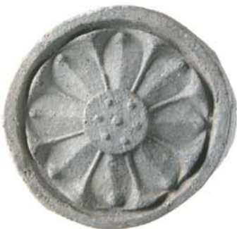
法興寺跡の軒丸瓦 (飛鳥時代/朝来市埋蔵文化財センター蔵)

但馬最古の寺院は、朝来市和田山町にある法興寺跡です。ここは但馬随一の交通の要衝にあたるため、中央政府による但馬統括の拠点ともなっていたのでしょうか。