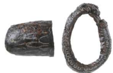
銀象嵌を施した刀飾り (古墳時代/楯縫古墳出土)

楯縫古墳がある豊岡市日高町は、8世紀以降の但馬の中心地。楯縫古墳の被葬者の末裔たちは、後に但馬国を支えていったに違いありません。