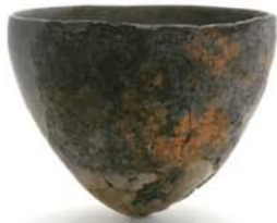
祢布ヶ森遺跡の縄文土器（縄文時代）

しかし、この地が栄えていたのは平安時代だけではありません。祢布ヶ森遺跡からは、縄文土器をはじめとした「国府以前」の古い資料が多く出土していて、長期間にわたり多くの人々が生活していたことがわかります。国府という但馬の都を造るにあたっては、人の生活に適した、安定した土地が選ばれたのでしょう。