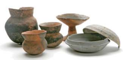
祢布ヶ森遺跡の土師器・須恵器（古墳時代）